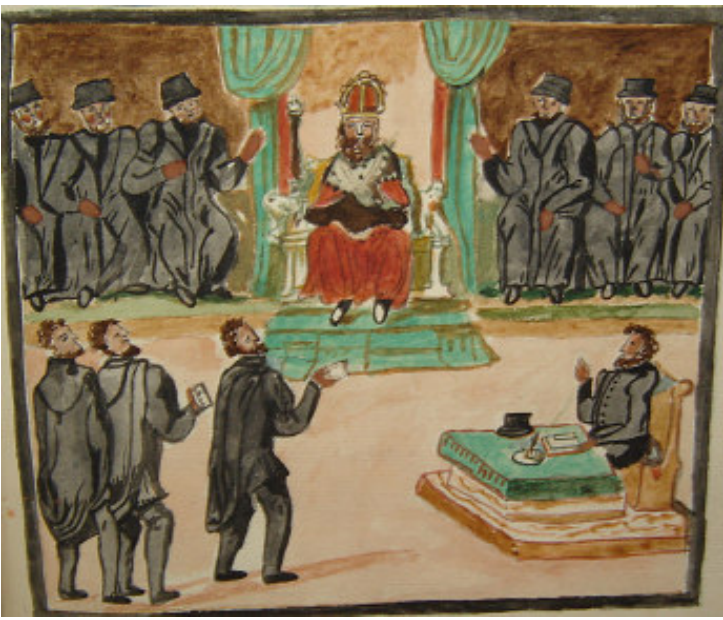
(Universiteitsbibliotheek Gent, Hs. 131, f° 125 r°)